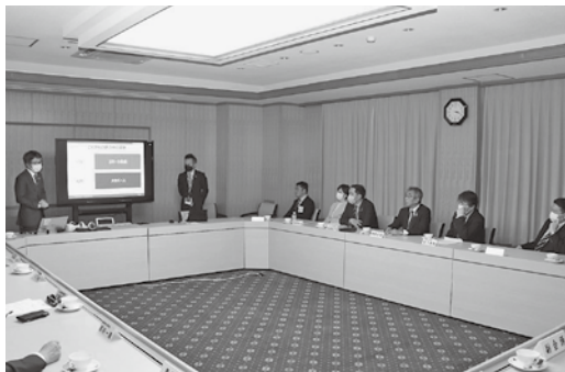
講師の話に耳を傾ける委員ら