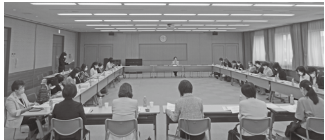
通常総会のようす