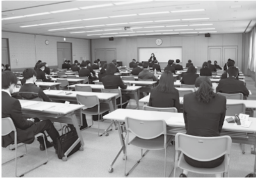
研修を受ける新社会人ら